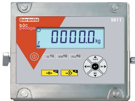
Clavier ergonomique et étanche