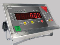
S911 IP68 Clavier - p.49