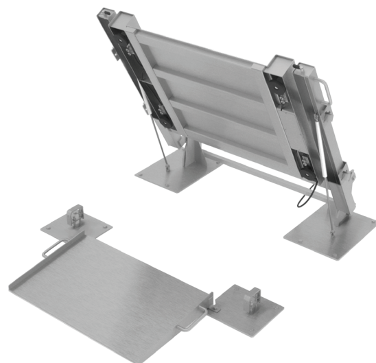
Rampe d'accès de série