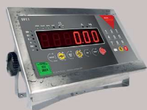
S911 IP68 Clavier