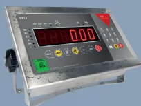
S911 IP68 Clavier